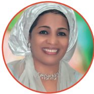
Dr. Lalla Malika Issoufou

Première Dame du Niger, est la marraine de L'Oasis